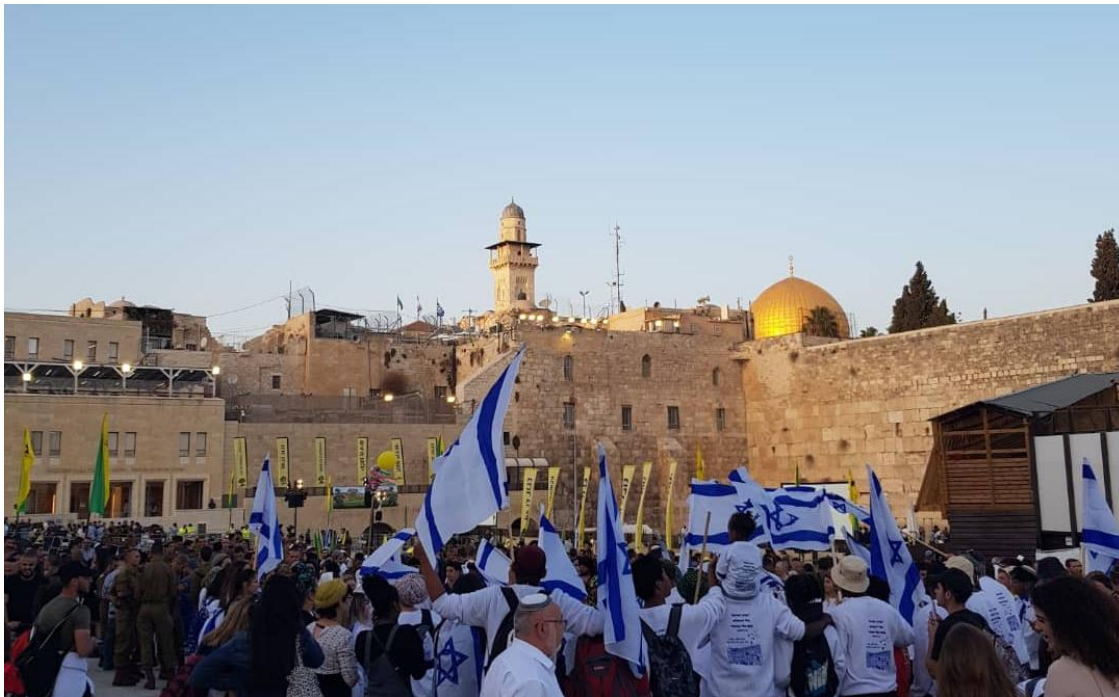
Western Wall, Jerusalem