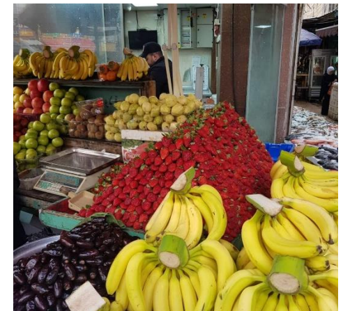
Obststand auf einem Shuk