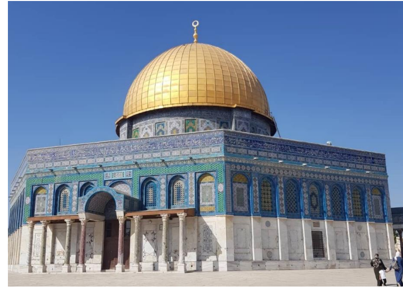
Dome of the Rock, Jerusalem